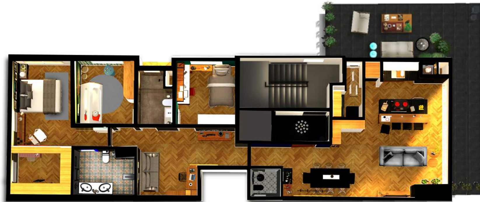
APARTAMENTO 101 ÁREA GLOBAL: 191,13 M 2 ÁREA PRIVATIVA: 159,03 M 2