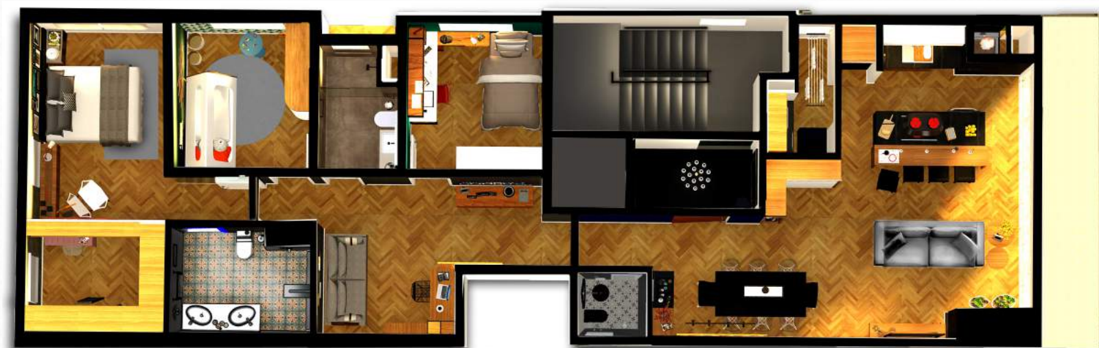
APARTAMENTOS 201, 301, 401 E 501 ÁREA GLOBAL: 170,33 M 2 ÁREA PRIVATIVA: 140,53 M 2