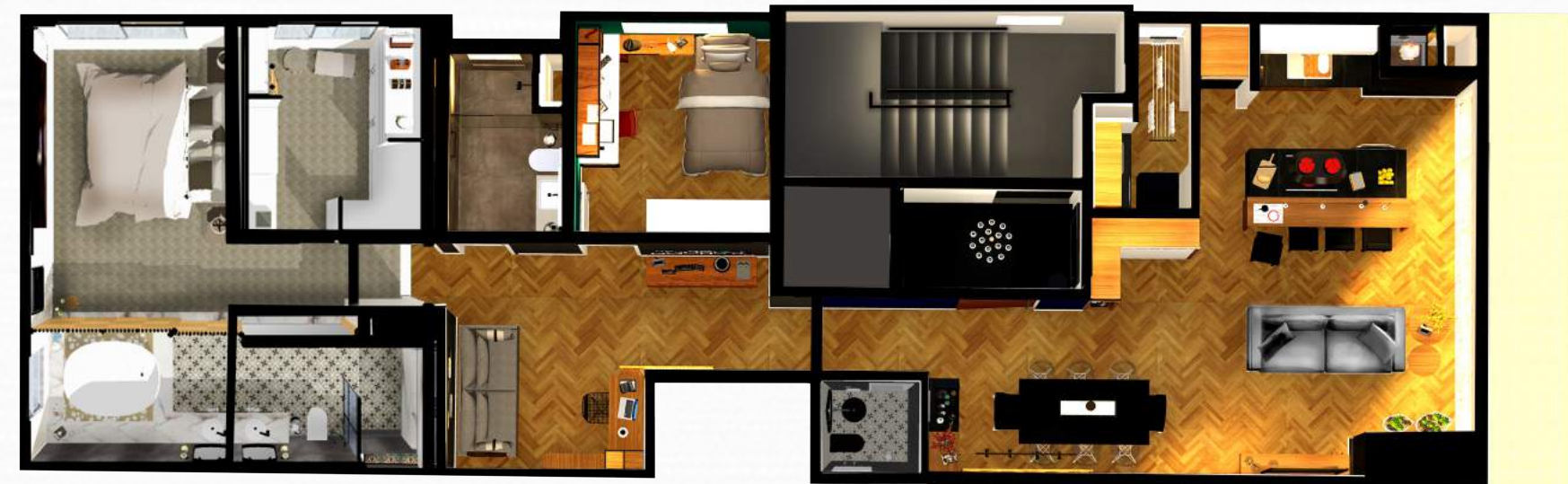
PLANTA OPCIONAL PARA OS APARTAMENTOS 201, 301, 401 E 501